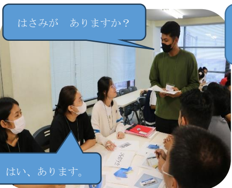
写真4: 各売り場へ行ってほしいものを探します