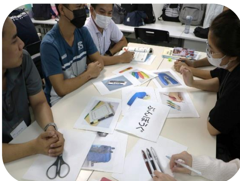
写真2: 売り場に商品の写真を配付