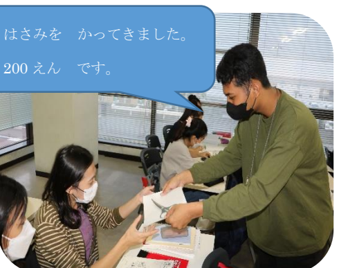
写真5: 買ってきたものと金額を報告します。