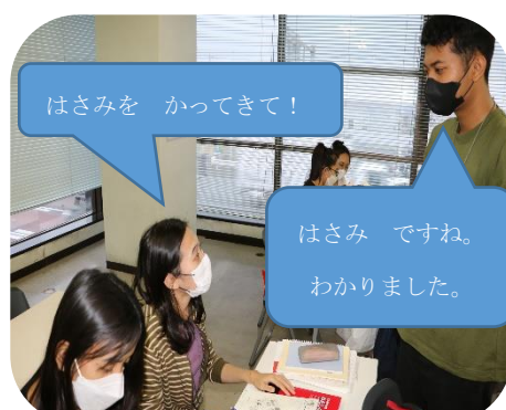
写真3: 買い物をペアの相手に頼みます