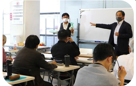
教室での感染拡大防止対策を確認する講師陣

待望の実習生との再会が間近に迫った直前研修会ということもあり、これまで以上に熱のこもった講師研修会となりました。