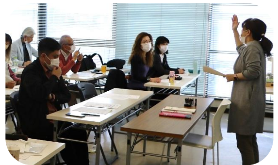
新テキストでの指導を確認する講師陣