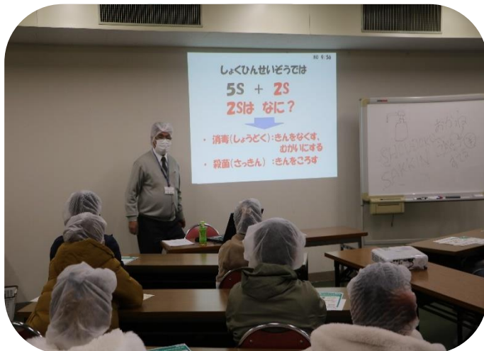
パワーポイントを使って見てもわかりやすい授業を行いました