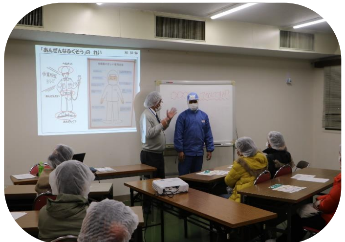
受講生の服装をチェックしながらわかりやすく説明しました