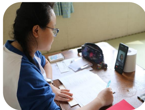
自分のスマホを端末にして生活指導を受ける実習生