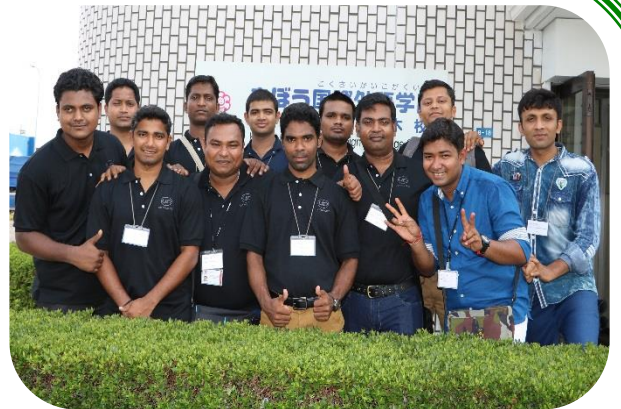
講習修了記念に校舎前で集合写真を撮る実習生

正直なところ本校では、インド人実習生の日本語講習受講に際して「日本語はどのくらいできるのだろうか?」「他の国からの実習生の皆さんと、上手く集団生活を送っていただけるのだろうか?」「日本の生活に馴染むことが出来るのだろうか?」等々、受入当日まで不安ばかりが先行していました。ところが、日本語指導や寮生活を通して受けた印象は、ズバリ「明るくて、とても真面目」。他者への気配り、目上の人に対する敬意の払い方など、日本の精神文化と共通する点も多く、受入前の不安はアッと言う間に飛び去りました。また、実習生の皆さんからも、「にほんはインドは、ぶんかがにています」と言う言葉を何度も耳にしました。分からない事があれば直ぐに質問してきたり、講師や他の国からの実習生に進んで話しかけたりする等、日本語コミュニケーションにも積極的で、とてもフレンドリーな面もあるので、実習先でもきっと好意を持って受け入れられることでしょう！皆さんの今後の技能実習での活躍を、スタッフ一同、陰ながら応援しています。