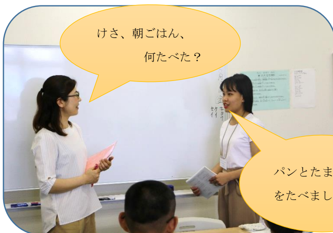
ペアになり健康チェックをし合う実習生の皆さん