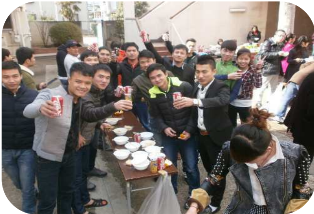
カンパニー。あけまして おめでとうございまーす

「新年好!」「 Chúc mừng năm mới! 」。2月21日(土)、あじけん恒例となった中国の「春節」・ベトナムの「テト」(今年は2月19日)を祝う昼食会が行なわれました。今年、過去最多の7ヶ国(中国・ベトナム・タイ・フィリピン・ミャンマー・インドネシア・マレーシア)からの総勢115名の実習生の皆さんが参加を希望したこともあり、あじけん中庭での開催となりました!幸い天候にも恵まれ、青空の下、食べ切れないほどの手作り餃子に、お菓子や果物、また豪華賞品満載のBINGOゲームと、楽しく新年を祝うことができました。また、本校講師陣からも多数の参加希望者があり、実習生の皆さんは、クラスメイトだけでなく、先生方とも覚えてたての日本語を駆使して、交流を深め合っていました。