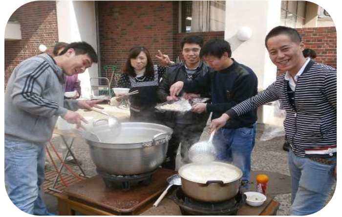
炊き出し用の大なべで作る水ギョーザ。外で食べる餃子の味は格別でした。