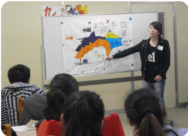
写真1：プレゼンテーション

各グループの発表時間は1人2分～3分程度。発表原稿は暗記が基本です。また、聴衆に分かりやすいプレゼンテーションにするために、明瞭な発音・正しいイントネーションでの発表が要求されます（写真1）。発表後は、発表内容についての質疑応答の時間があるので、ここで実習生の皆さんは、より実践的なコミュニケーション活動を行なうことが出来ます（写真2）。また、発表内容は実習生の皆さん自身によってビデオ撮影され、後日行なわれるフィードバック（下記カリキュラム7）に活用されます。