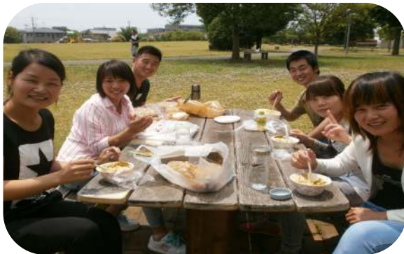
交流センターに隣接する公園でお弁当を食べる中国人実習生の皆さん

去る5月23日に「法的保護に関する講習会」が行なわれました。今回は参加者数の関係で、小山市地域交流センターを会場として実施されました。本校から会場まで、徒歩で30分程かかるため、昼食はお弁当を持参しました。実習生の皆さんの、国際色豊かなお弁当をご覧ください。