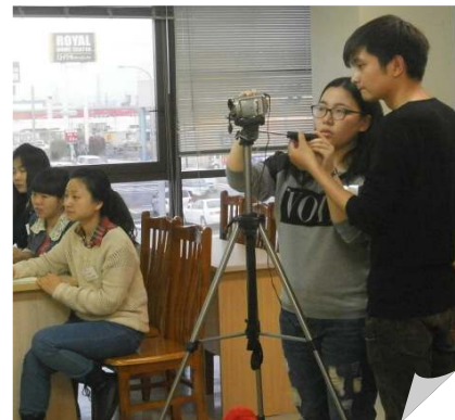
真剣な表情で発表を撮影する撮影係の実習生

※ 当校ホームページ http://www.ajiken.jp/ から「あじけん通信」バックナンバーもご覧になれます